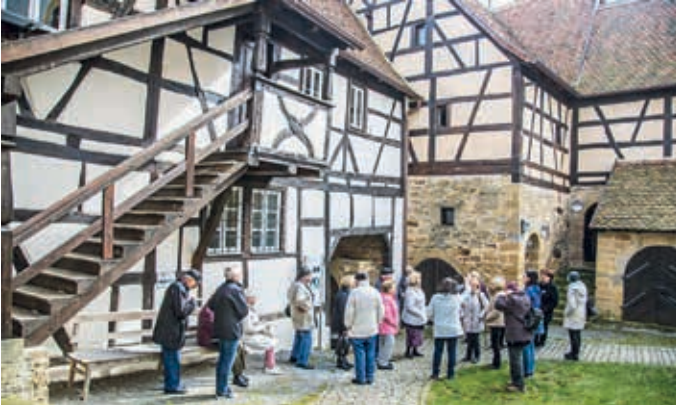
Der Seniorenkreis am 15. März im Kirchenburg-Museum Mönchsondheim.

Auch im Jahr 2018 wurden unsere Fahrten von Schutzengeln begleitet. „Gott hat seinen Engeln befohlen, dass sie uns bewahren auf allen unseren Wegen“ (Psalm 91,11). Deshalb sind wir dankbar, alle Fahrten glücklich und wohlbehütet überstanden zu haben.