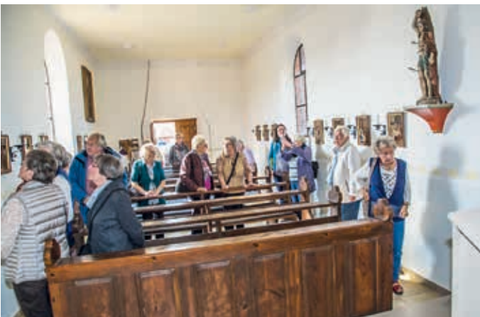
Am 18. Oktober besuchten wir die Antonius Kapelle in Sterpersdorf.