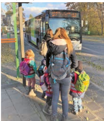
„Eisbären“ warten auf ihren Bus

Die Braunbärengruppe hat sich mit den beengten Verhältnissen in der Garderobe des Mesnerhauses mittlerweile arrangiert und nutzt alle Räume zum Anziehen. Die Kinder lernen dabei immer mehr Rücksicht aufeinander zu nehmen. Jeden Tag starten sie mit Vorfreude auf den Weg zum Spielplatz im Schlosspark, den nun alle schon auswendig kennen. Auf dem Platz vor der Kirche wird fleißig mit Straßenkreide gemalt, und natürlich wird er auch zum Fußballspielen genutzt. Auch der Platz am Bärenhässchen bietet jetzt viele Spielmöglichkeiten.