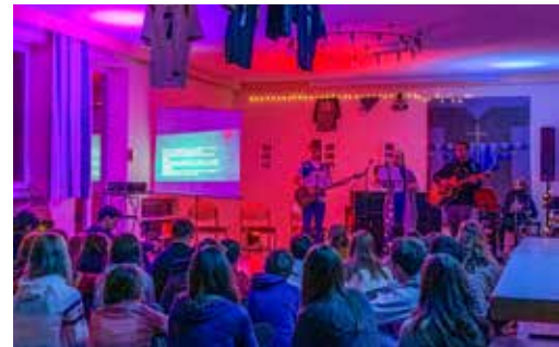
Lichterketten, Teelichter und bunte Spots ließen den Saal buchstäblich in ganz neuem Licht erstrahlen.