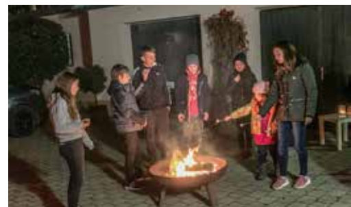
An der Feuerschale wurden danach noch Marshmallows gegrillt.