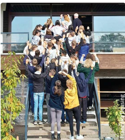
Großer Andrang bei der Konfi-Freizeit in Münchsteinach

In den nächsten Wochen werden wir unsere Konfirmationsprüche aussuchen und unseren Vorstellungsgottesdienst vorbereiten. Sie sind herzlich eingeladen am 13. April um 9.30 Uhr in der St. Johannes Kirche mit uns diesen Gottesdienst zu feiern.