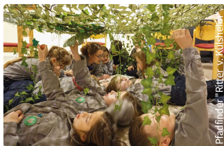
Dschungelbuch Höhle zum Vorlesen

Eure Christliche Pfadfinderschaft „Ritter von Kilsheim“